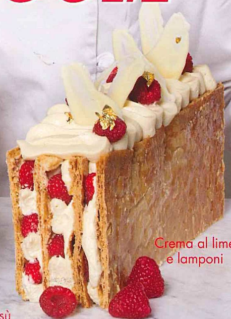
Crema al lime e lamponi

RE €7,90 - D €9,00 - LUX €7,20 - PTE CONT. €7,50 - CHCT 9,90 CHF