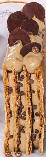
Crema tiramisù e caffè