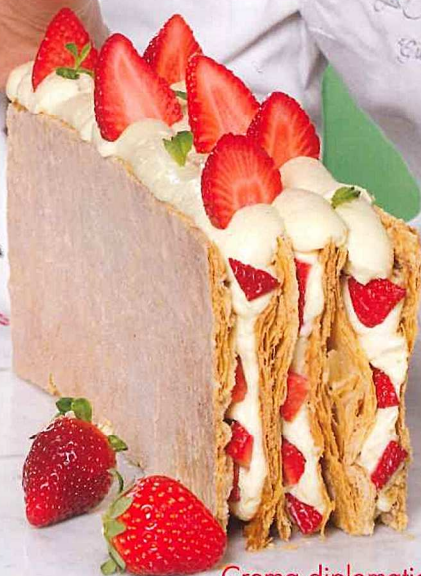
Crema diplomatica e fragole